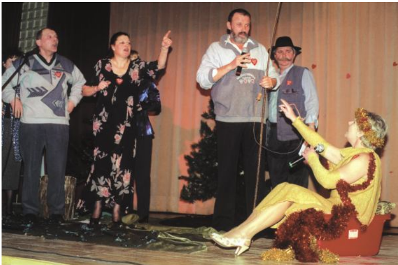
Czego chcesz człowieku? - pyta „złota rybka” w premierowym programie kabaretu „Onufry”