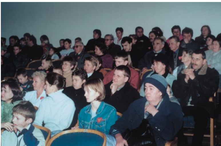
Ludzie gorących serc.