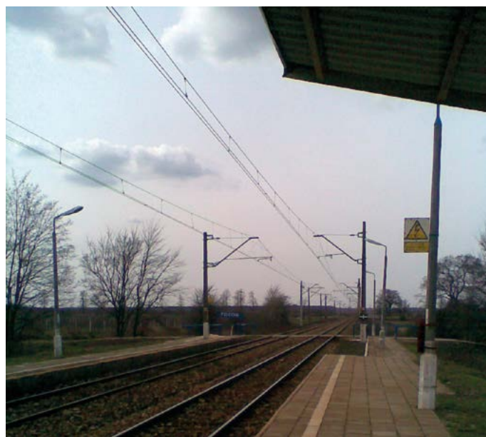
Dawna stacja w Pożogu – fot. autora.

Cieśla - budowniczy dworca drewnianego w Puławach miał narzeczoną w Końskowoli. W wolnych chwilach chodził pieszo po brukowanej drodze do swojej dziewczyny. Z chwilą ukończenia budowy dworca zdarzyła się tragedia. Na drodze biegnącej w kierunku Końskowoli znaleziono martwego budowniczego dworca. Przeprowadzono śledztwo, ale nie udało się stwierdzić, co było przyczyną śmierci. A życie toczyło się dalej. Dworzec kolejowy „Puławy Drewniane” oddano do użytku i wielu mieszkańców Końskowoli i okolic korzystało z nowoczesnego środka transportu. Pociągi przyjeżdżały w różnym czasie - część docierała do stacji już po zmroku.