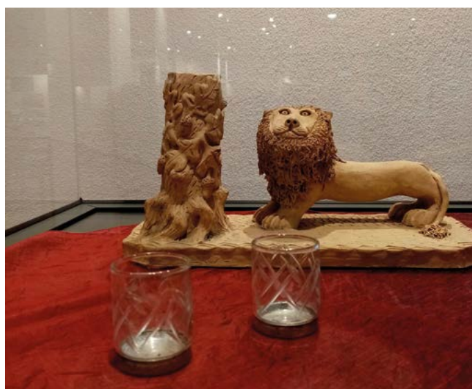
Świecznik gliniany z okresu międzywojennego, wypalony w kaflarni w Końskowoli przez pracownika. Udostępniony na wystawę ze zbiorów p. Teresy Rybickiej.

Duży stopień zróżnicowania gmin pod względem liczby urzędników kahalnych występował w całym województwie lubelskim. W Końskowoli utrzymywano 4 kahalnych - wybieranych przez mieszkańców, których zadaniem było głównie pobieranie podatków, zarządzanie gminą, dbanie