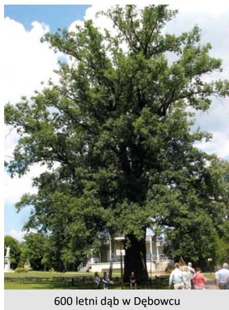
600 letni dąb w Dębowcu

brze od ponad 600 lat, pamiętający wizytę króla Władysława Jagiełły. Tak więc Msza Święta, prelekcja, modlitwa i zwiedzanie tego miejsca a także obejrzenie filmu o wydarzeniach w La Salette było dla nas dużym przeżyciem. Jeszcze tylko zakup pamiątek i krótki czas refleksji dobiegł końca. Ostatnim akcentem naszego pobytu w sanktuarium była prywatna adoracja Pana Jezusa w Najświętszym Sakramencie w kaplicy wieczystej adoracji - przepięknej kaplicy w podziemiach kościoła, gdzie Pan Jezus wystawiony jest cały czas przez okrągły rok, dzień i noc.