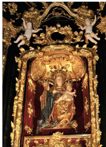
Święta Anna z sanktuarium w miejscowości Święta Anna

Na następną pielgrzymkę pojechaliśmy w Bieszczady. Pierwszym sanktuarium na trasie trzydniowej pielgrzymki był Dębowiec. Aby zrozumieć Sanktuarium Matki Bożej Saletyńskiej trzeba się cofnąć myślą do 19 września 1846 roku. Tego dnia we francuskich Alpach, w bardzo wysokich górach, dwojgu pastuszkom - Melanii i Maximowi objawiła się Matka Boża. Siedząc na skale w ubraniu wiejskiej dziewczyny bardzo płakała. Matka Boża żaliła się dzieciom, że ludzie ciężko obrażają Boga i Jej Syna Jezusa Chrystusa... Nie chodzą w niedzielę na mszę świętą, nie przystępują do sakramentów, przeklinają, żyją jakby Boga nie było. Ostrzegła, że jeśli ludzie się nie nawrócą - będzie kara Boża, śmierć i głód. Wkrótce stało się to rzeczywistością. Kiedy do Polski przybyli Saletyni w 1902 roku - męskie zgromadzenie zakonne - zakupili parcelę w Dębowcu na Podkarpaciu