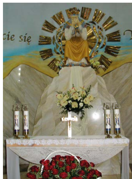
Polskie La Salet - sanktuarium w Dębowcu

i z La Salette przenieśli kult Płaczącej Madonny na grunt do polskiego kościoła. Podczas II Wojny Światowej Niemcy zrujnowali klasztor i dopiero w 1966 r. stanął tu nowy kościół. Dziś w jego kaplicy znajduje się cudowna figura płaczącej Madonny - Pojednawczyni Grzeszników. Figura została ukoronowana koronami papieskimi w 1996 r., a w 2012 r. kościół został podniesiony przez stolicę apostolską do godności Bazyliki Mniejszej. U stóp Kalwarii, obok kościoła, rośnie dostojny olbrzymi dąb mający się do-