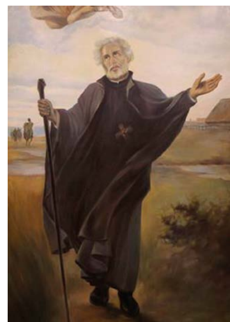
Św. Andrzej Bobola

Miejsce to jest szczególne na mapie polskiego kościoła. Na skraju miejscowości stoi kościół parafialny. Tu przyjął chrzest św. Andrzej Bobola, patron Polski. Pamiętają to 600-letnie dęby, które rosną do dziś obok kościoła i dobrze się mają. Święty Andrzej ostatnimi czasy objawiał się tu dwóm proboszczom, wiele razy prosząc o ogłoszenie go patronem Polski i o modlitwę w intencji ojczyzny za jego przyczyną. Obiecał w ciężkich czasach uratować Ojczyznę od groźnych jej niebezpieczeństw. Modlitwa do świętego Andrzeja Boboli i jego wstawiennictwo u Boga jest przyczy-