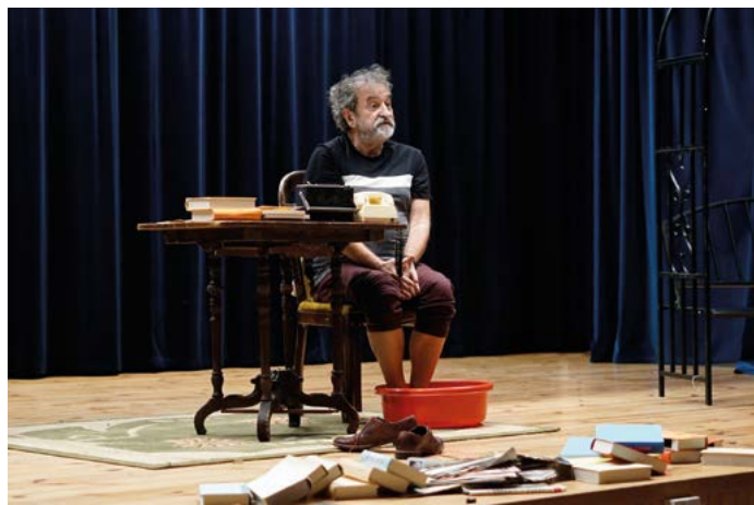
Spektakl teatralny „Spóźniona miłość, czyli wyznania starego belfra”