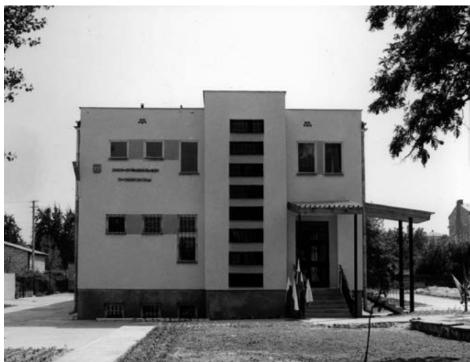
Uroczyste otwarcia nowego lokalu Banku (nowej siedziby Banku) w Końskowoli przy ul. Lubelskiej - 12 lipca 1984 r.

Rok 2021 zaczęliśmy kolejną poważną zmianą, przyłączyliśmy Bank Spółdzielczy w Księżpolu. Przyłączenie Banku oddalnego od Puław o ok. 150 km było wielkim wy-