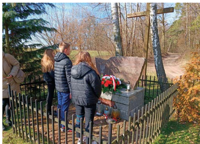
Młodzież złożyła hołd poległym