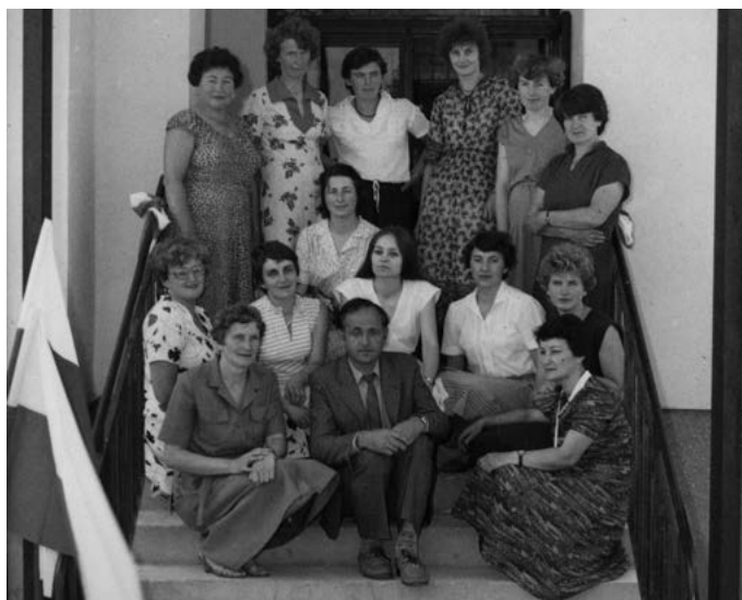
Załoga Banku w pierwszych latach działalności – 1984 r.