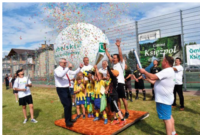
Młodzieżowy Turniej Piłki Nożnej o Puchar Prezesa Lubelskiego Banku Spółdzielczego i zwycięska drużyna piłkarze z Powiślak Końskowola rocznik 2013 - 18 czerwca 2022 r.

W 2009 roku Bank nawiązał współpracę z Towarzystwem Ubezpieczeniowym Concordia (obecna nazwa to Generali Życie Towarzystwo Ubezpieczeń S.A.). Dzięki tej współpracy Bank zaczął oferować swoim klientom oprócz produktów typowo bankowych, również ubezpieczenia, które nieustannie cieszą się zainteresowaniem.