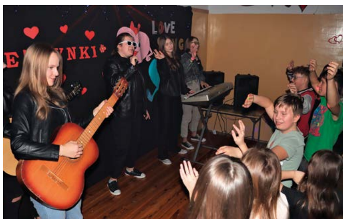
Przeгляд piosenek o miłości „Love song”

Przed południem w pięknie udekorowanej sali, tańczyły i śpiewały przedszkolaki oraz uczniowie klas młodszych. Dzieci przebrane były za swoich ulubionych bohaterów. Samorząd Uczniowski na czas zabawy przygotował dodatkowe atrakcje: walentynkową sesję fotograficzną, malowanie twarzy oraz popcorn.