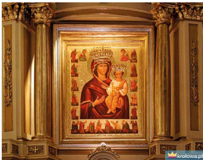
Matka Boska Rudecka z Sanktuarium w Jasieniu https://krolowa.pl/krolowa-bieszczad-w-jasieniu/