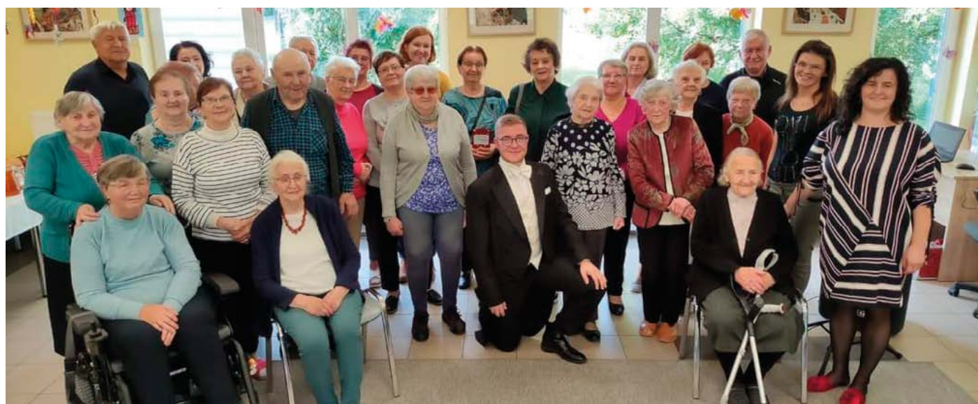
Pracownicy DDP w Starej Wsi wraz z podopiecznymi