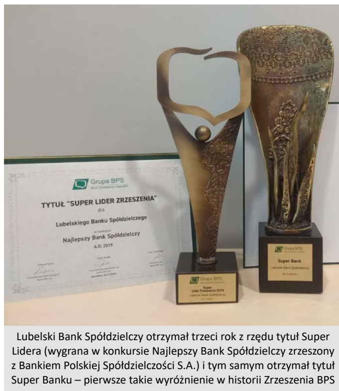
Lubelski Bank Spółdzielczy otrzymał trzeci rok z rzędu tytuł Super Lidera (wygrana w konkursie Najlepszy Bank Spółdzielczy zrzeszony z Bankiem Polskiej Spółdzielczości S.A.) i tym samym otrzymał tytuł Super Banku – pierwsze takie wyróżnienie w historii Zrzeszenia BPS

w grudniu 2020 r. w konkursie „Najlepszy Bank Spół-