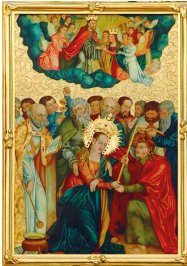
Wizerunek Matki Bożej Zaśnięcia i Wniebowzięcia z Sanktuarium w Starej Wsi https://www.ampolska.co/Artykuly/Miejsca/art-539-Ogien-i-profanacja.htm

Pomimo dwukrotnego spalenia obrazu, w wiernie odtworzonym wizerunku, Matka Boska nadal nieustannie obdarza swój lud łaskami. A Stróżami tego miejsca są jezuici. Do Bazyliki i klasztoru zbudowanych na wyniosłym wzgórzu prowadzą liczne schody. Zarówno fasada jak i wnętrza są imponujące. Piękna i przestronna bazylika, jest nazywana perłą baroku na Podbeskidziu. Połączona z klasztorem tworzy piękny kompleks zabytkowych wnętrz. Jezuici stworzyli tu skarbiec i muzeum sprowadzając zabytki i eksponaty z całego świata. W wielu salach znajdują się także zabytki ojczyste, z których można odtworzyć historię i kulturę Polski i polskiego Kościoła. Trudno to wszystko pomieścić w głowie, tyle wspaniałych pamiątek, przedmiotów i ich historii. Wszystko pod okiem zakonników jest pilnie strzeżone, za pancernymi drzwiami i zaszyfrowanymi zamkami. Podczas długiego zwiedzania, musiałem iść ostatni, aby za sobą zamykać te ciężkie i potężne drzwi sejfowe.