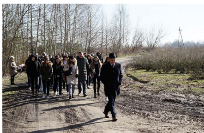
W drodze do pomnika w Lesie Stockim