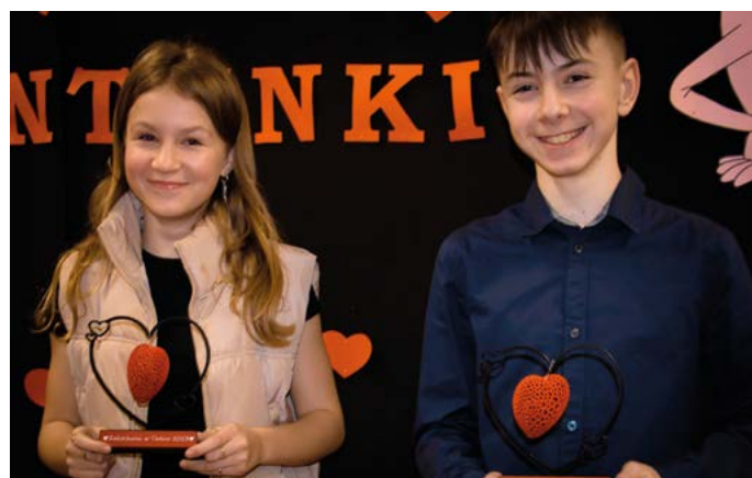
Zwycięzcy konkursu „Zakochani w tańcu” 2023