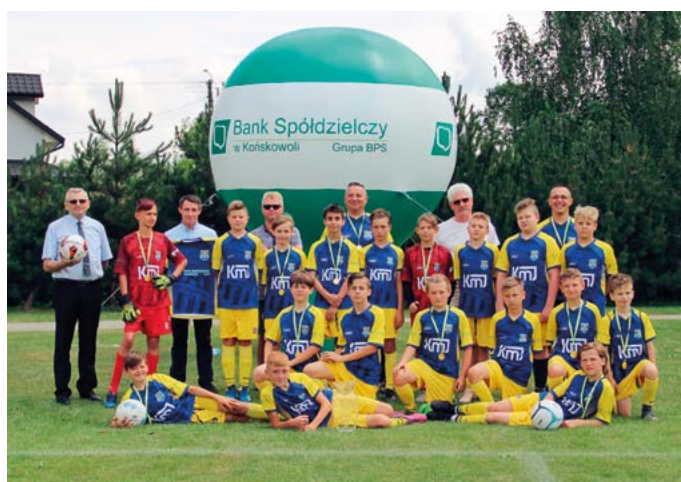
Powiślak Końskowola (rocznik 2006) - VI Turnieju Piłki Nożnej o Puchar Prezesa Zarządu Banku Spółdzielczego w Końskowoli rok 2019 r.