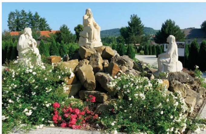
Ogród biblijny w Sanktuarium w Starej Wsi https://starawies.jezuici.pl