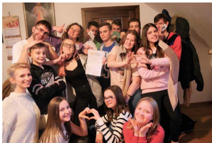
Piątkowe, cotygodniowe spotkanie w salce na plebanii

Największym jednak wsparciem zostaliśmy obdarzeni przez naszą Opiekunkę, Matkę Najświętszą. To Ona wyprasza nam potrzebne łaski, to Jej zawieramy wszystkie nasze działania, każdy spektakl. To Ona była z nami przez te 10 lat, kiedy działo się dużo dobrego, ale wtedy też, gdy było ciężko, jak np. w czasie pandemii, która bardzo utrudniła nam możliwość działania. Z Jej pomocą daliśmy jednak radę. Dlatego właśnie każdego 13. dnia miesiąca oddajemy cześć Matce Bożej podczas nabożeństw Bractwa Różańcowego, podczas którego szczególnie modlimy się