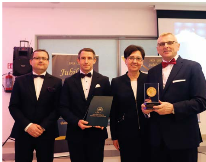
Wręczenie Złotego Medalu za Zasługi dla Spółdzielczości Bankowej im. Franciszka Stefczyka Lubelskiemu Bankowi Spółdzielczemu