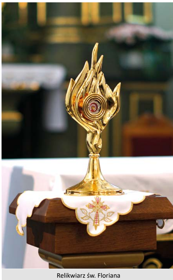
Relikwiarz św. Floriana