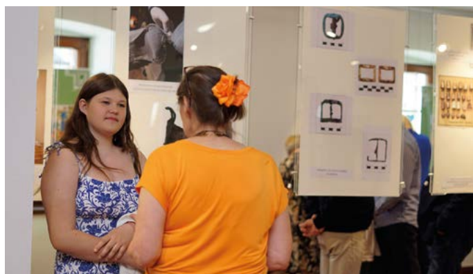
Pani Profesor odpowiadała na wiele pytań