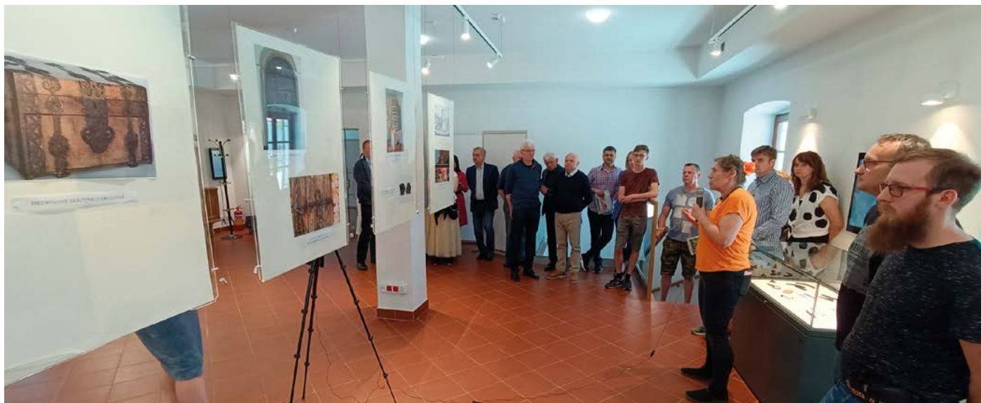
Prelekcja Pani Profesor na temat wyposażenia budynków folwarku w Opoce

kość wykonania dowodzą, że ani zabudowania w Opoce ani ich wyposażenie nie odbiegało od znanych, analogicznych, opisanych w literaturze budowlanej w Polsce i Europie. Potwierdzeniem tego są zdjęcia podobnych, zachowanych w całości, przedmiotów z innych stanowisk archeologicznych oraz zabytkowych budynków, które zostały zamieszczone w sali wystawowej Ratusza. Pani Profesor barwnie opowiadała o pracy archeologa, zabytkach dokumentujących rozwój cywilizacji i weryfikujących historię. Liczne grono miłośników Końskowoli obecnych na wydarzeniu zasypało naszego gościa pytaniami dotyczącymi Opoki, poszczególnych przedmiotów i rekonstrukcji strojów.