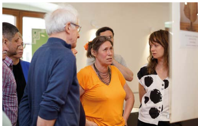
Pani Profesor odpowiadała na wiele pytań