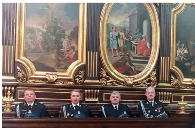
Przedstawiciele strażaków na Mszy Św. w bazylice św. Floriana w Krakowie