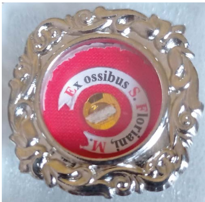
Kapsuła z kością św. Floriana