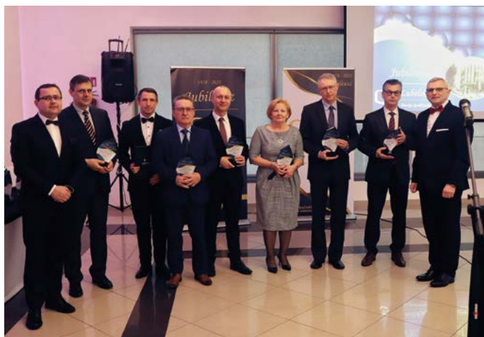
Zarząd oraz Rada Nadzorcza Lubelskiego Banku Spółdzielczego